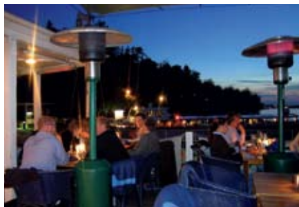
Restaurang J i Nacka Strand.

8 Nacka Strand. Genuin fabriksmiljö från 1800-talet med ståtliga tegelbyggnader som omvandlats till ett modernt bostads- och kontorsområde. Carl Milles "Gud Fader på Himmelsbågen" vaktar hamnen.