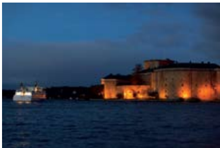
Vaxholm.