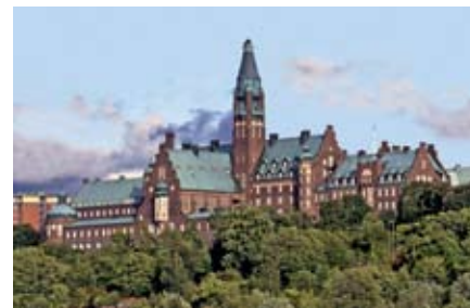
Danvikstulls sjukhem.

6 Danvikstulls sjukhem med lägenheter för äldreboende. Pampig byggnad som vid något tillfälle lär ha förväxlats med vårt kungliga slott.