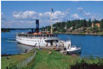
Ljusterö.