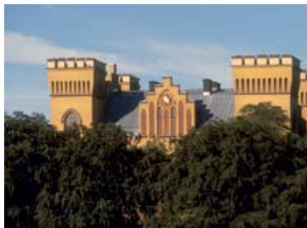
Bogesunds Slott.

Sveriges holme used to be called Little Sweden, as this was the border up to which Swedish law applied. Just next door is Danmarks holme which is said to have been besieged by the Danish king Kristian Tyrann after a battle with Gustav Vasa in the 16 th century.