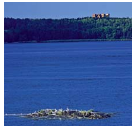
Askrikefjärden.